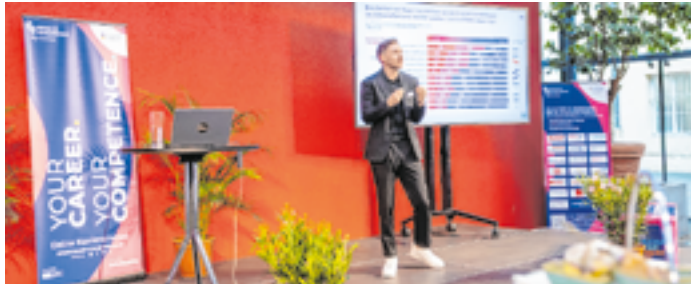
Beim Pre Opening wurden die 20. Auflage der career & competence und 40 Jahre SoWi-Holding gefeiert. Zukunftsforscher Tristan Horx setzte inhaltliche Impulse.

Am 29. April drehte sich im Congress Innsbruck alles um: your career, your competence.