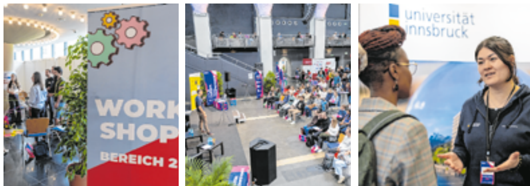
Während an den Messeständen Jobs, Praktika und Masterstudiengänge im Fokus standen, boten Career Talks und Workshops praxisnahe Impulse rund um Karriere, Bewerbung und Networking. Besonders gefragt waren zudem die Bewerbungsfotos sowie CV- und LinkedIn-Checks.