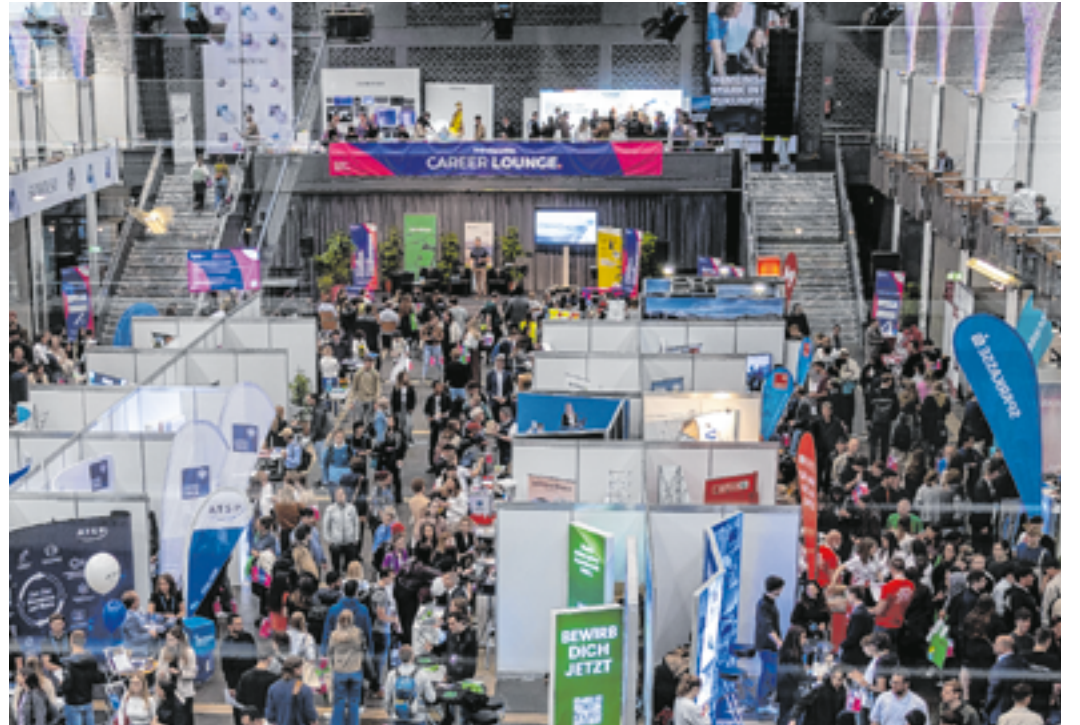
Die positive Stimmung auf der Karrieremesse war deutlich spürbar. Die Besucher:innen freuten sich über die vielfältigen Chancen, um sich mit ca. 100 Aussteller:innen persönlich und auf Augenhöhe auszutauschen.