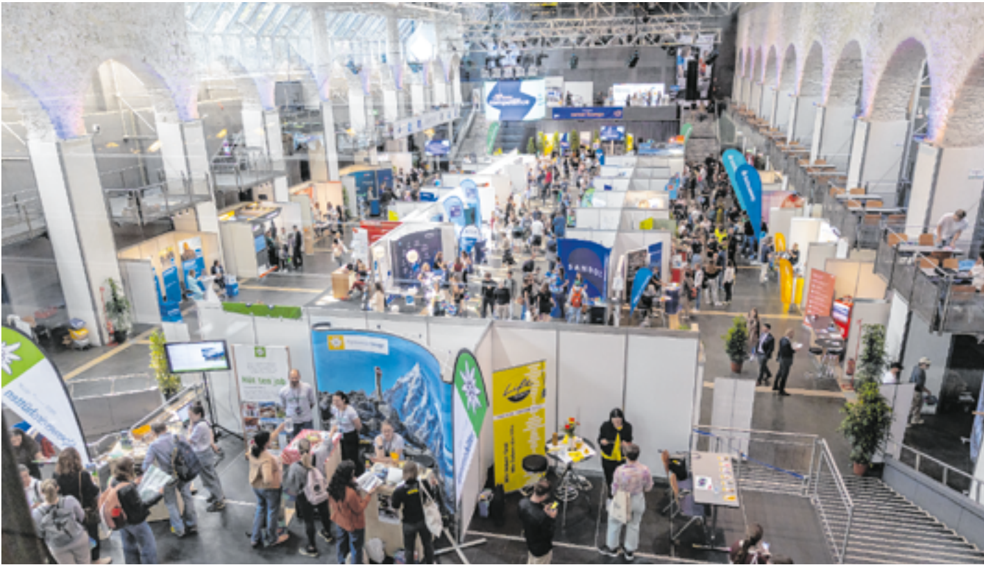
In Westösterreich gibt es nichts Vergleichbares in dieser Größenordnung: Auf der career & competence treffen über 100 Unternehmen und Hochschulen auf ca. 1.800 Studierende, Absolvent:innen und (Young) Professionals.