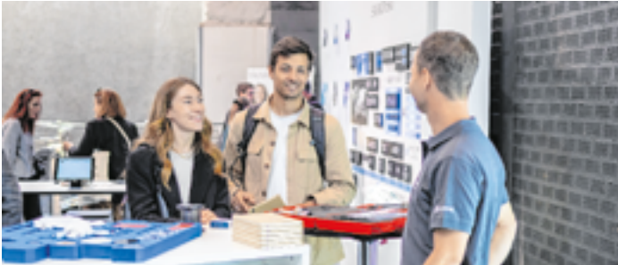
Ob am Messestand, in Workshops, beim Bühnenprogramm oder Pre Opening – die career & competence bietet vielfältige Möglichkeiten zur Vernetzung.